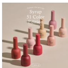
カラーパレット 1 VS21～28