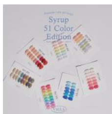
カラーチャート 43 種