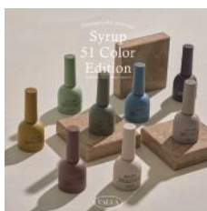
カラーパレット 2 VS29～36