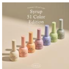
カマンベルチーズ VS08～14